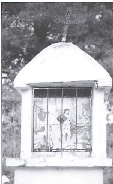
Paso I: Jesús condenado a muerte. Familia Latorre-Castillo. Las 14 estaciones fueron construidas en 1944 y costaron 200 ptas. cada una.