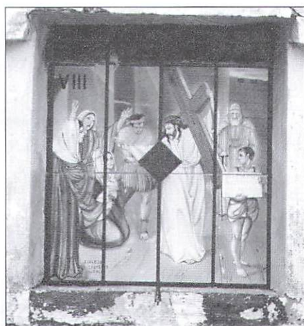
Paso VIII: Jesús habla a las hijas de Jerusalén. Hermanos Ruiz-Ramírez.